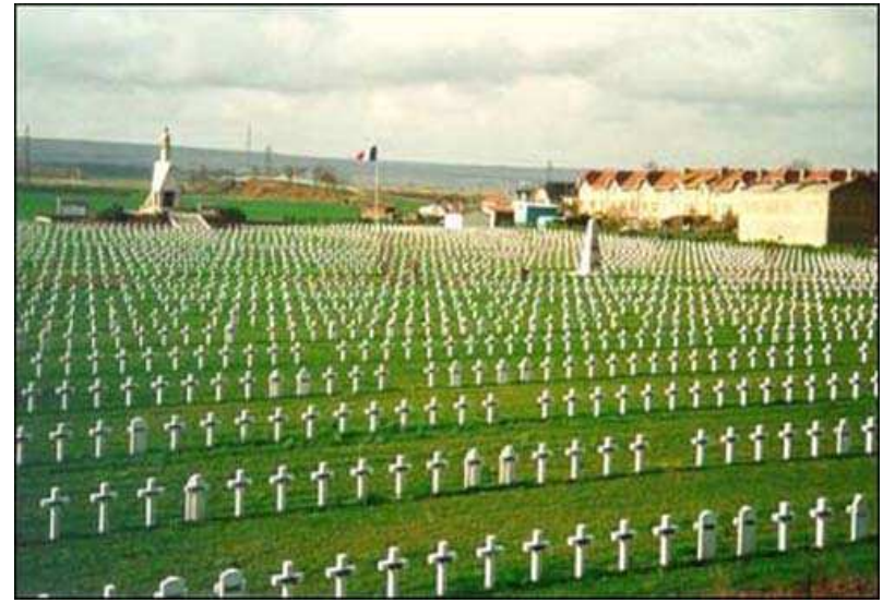
யுத்தத்தில் மரித்துபோனவர்கள் கல்லறையில்...

ஒரு நாடு இன்னொரு நாட்டை பிடித்துவிட்டது என்று சந்தோஷப்பட்டாலும் அந்த வெற்றியடைந்த நாட்டு மக்களிலும் தோல்வியடைந்த நாட்டு மக்களிலும் எத்தனை கோடி உயிர்கள் பலியாகிறது! முதலாவது யுத்தம் கடந்தது, இரண்டாவது யுத்தமும் கடந்தது, மக்கள் அதனுடைய விளைவுகளை அறிந்தார்கள். அது கொடுமை, அது மிக பயங்கரம் என்று கண்டு இனிமேல் யுத்தமே இருக்கக்கூடாது என்று நினைத்தோம், ஆனாலும் இன்று மக்கள் மூன்றாவது உலக மகா யுத்தத்திற்கு ஆயத்தப்படுத்திக்கொண்டிருக்கிறார்கள்.