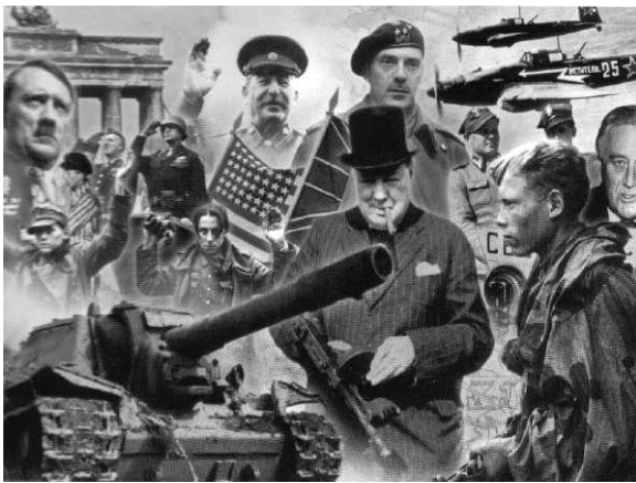
1939-1945 இரண்டாவது உலக மகா யுத்தம்