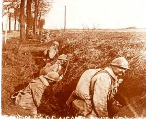
1914-1918 முதல் உலக மகா யுத்தம்

சில வருடம் கழிந்து இரண்டாவது மகா யுத்தம் வந்தது, அந்த யுத்தத்தில் ஆறு கோடிபேர் இறந்தார்கள், பதினைந்தாயிரம் பேர் காயமடைந்தார்கள். முதல் யுத்தத்தில் செலவழிந்ததைவிட இருபது மடங்கு அதிகமாக செலவழிந்தது. யுத்தத்தில் எல்லா பக்கத்திலும் சாவுதான் அதிகமாயிருந்தது! யுத்தத்தினால் கோடிக்கணக்கான மக்கள் அழிவதை தவிர வேறு எப்படி அது முடிகிறது?